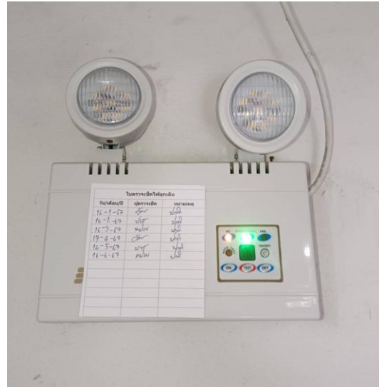
อุปกรณ์ป้องกันอัคคีภัย และอุปกรณ์แจ้งเหตุอัคคีภัย