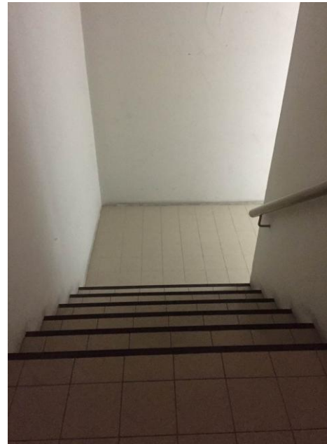
ป้ายบอกทางหนีไฟ ประตุนีไฟ และบันไดหนีไฟ

รูปที่ 2.4.6-1 อุปกรณ์ป้องกันอัคคีภัย อุปกรณ์แจ้งเหตุอัคคีภัย ป้ายบอกทางหนีไฟ ประตูและบันไดหนีไฟ